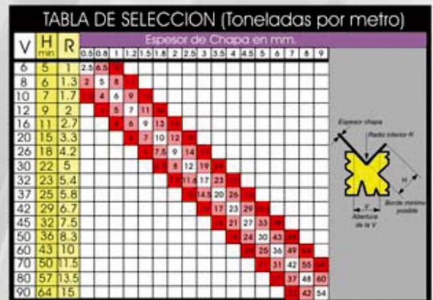
DIAGRAMA DE SELECCION DE MATRIZ DIES SELECTION SKETCH

La MP 2003 se adapta a las normas y directivas europeas de fabricación de PLEGADORAS MP 2003 is made according to the European regulation and directives for PRESS BRAKES